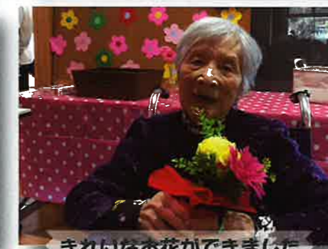
きれいなお花ができました