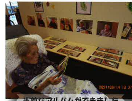
素敵なアルバムができました

今年度の敬老祝賀会も各ユニットでの開催となりました。長寿(100歳以上)の祝い3名をはじめ、皆様の節目のお祝いを一緒におこないました。