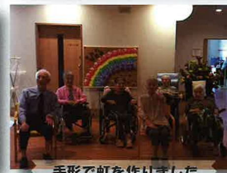
手形で虹を作りました