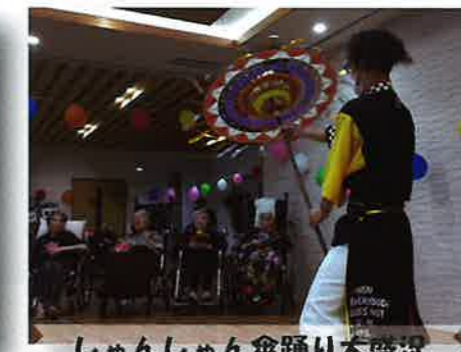
しゃんしゃん傘踊り大盛況