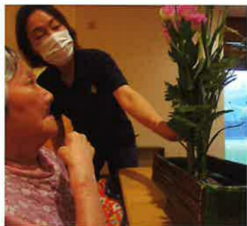
きれいに生けました♪