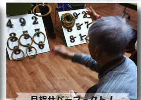
目指せパーフェクト！