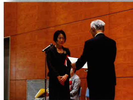
立正佼成会鳥取教会様

当法人の設立50周年記念式典が10月2日に鳥取県立福祉人材研修センターにて開催されました。その式典の中で、長年にわたりお世話になっているボランティア団体への感謝状贈呈式が執り行われました。当苑からは12団体に感謝状が贈呈され、その中から代表して2団体に出席していただき、ありがとうございました。今後とも、どうぞよろしく願っています。