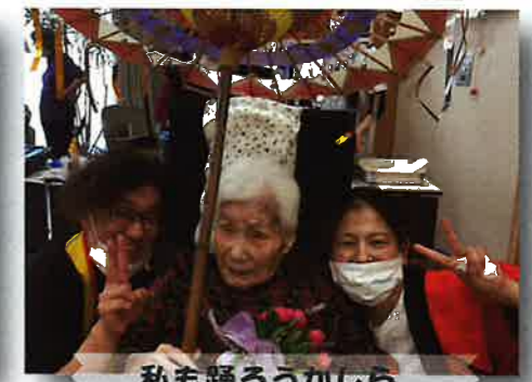
私も踊ろうかしら