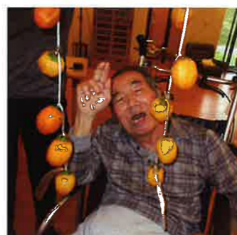
みんなで干し柿を作りました☆