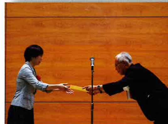
鳥取湖陵高等学校様

当法人の設立50周年記念式典が10月2日に鳥取県立福祉人材研修センターにて開催されました。その式典の中で、長年にわたりお世話になっているボランティア団体への感謝状贈呈式が執り行われました。当苑からは12団体に感謝状が贈呈され、その中から代表して2団体に出席していただき、ありがとうございました。今後とも、どうぞよろしく願っています。