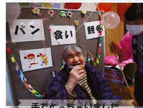
手でとっちゃいました