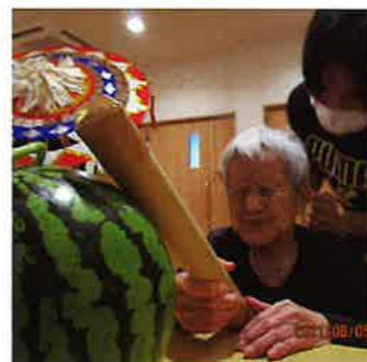
ヨイショ！割れるかな！?